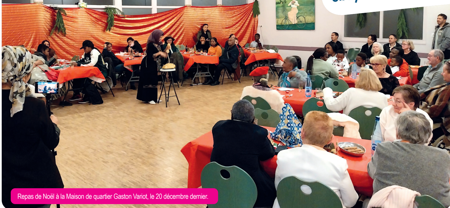
Repas de Noël à la Maison de quartier Gaston Variot, le 20 décembre dernier.