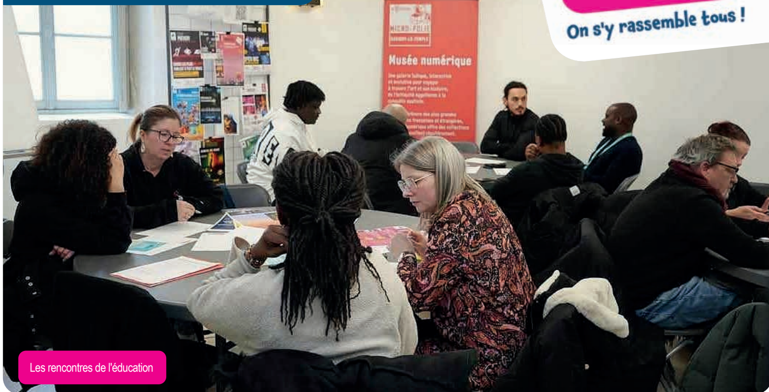
Les rencontres de l'éducation

GAZETTE DES CENTRES SOCIAUX #19 | JANVIER - FÉVRIER 2025