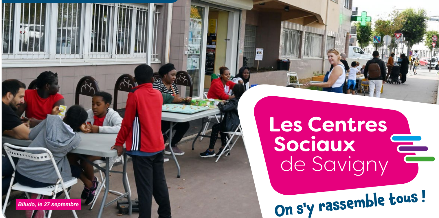
Biludo, le 27 septembre